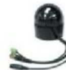
Pan-Tilt Dome Camera