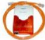
Alarmsirene inkl. Stroboskoplicht