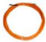
Temperatur- und Luftfeuchtigkeitssensor